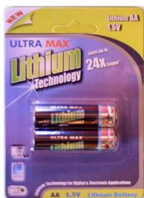
STILO AA LITIO 1,5V 2pz x Blister-10Bl.xSc. 2562