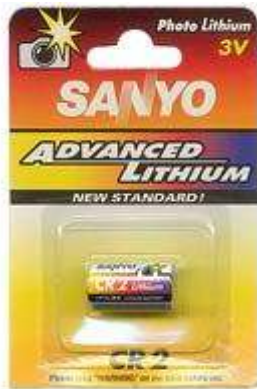
CR2 3V 1pz x Blister-10Bl.xSc. 25CR23