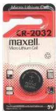
CR2032 3V 1pz x Blister-10Bl.xSc. 2520327