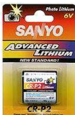
223 (CRP2) 6V 1pz x Blister-10Bl.xSc. 252CRP23