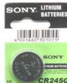
CR2450 3V 1pz x Blister-10Bl.xSc. 252450

Disponibili: cr1632 - cr2354 - cr1616 - cr1620 - cr1220