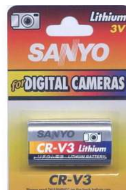
CR-V3 3V 1pz x Blister-10Bl.xSc. 25CRV383