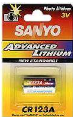
DL 123 3V 1pz x Blister-10Bl.xSc. 251233