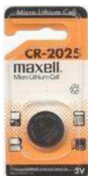
CR2025 3V 1pz x Blister-10Bl.xSc. 2520257