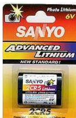
245 6V 1pz x Blister-10Bl.xSc. 252CR53