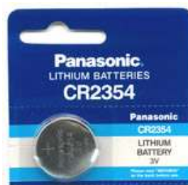
CR2430 3V 1pz x Blister-10Bl.xSc. 252430