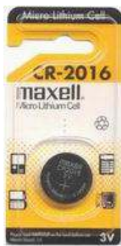
CR2016 3V 1pz x Blister-10Bl.xSc. 2520167